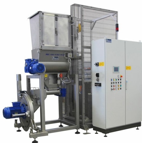
REC 1001 C/A/I