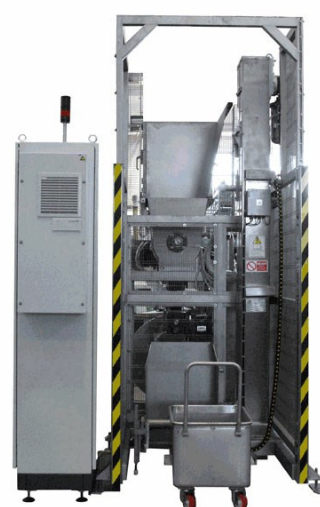
Система загрузки вагонеток