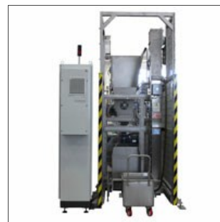
Система загрузки вагонеток