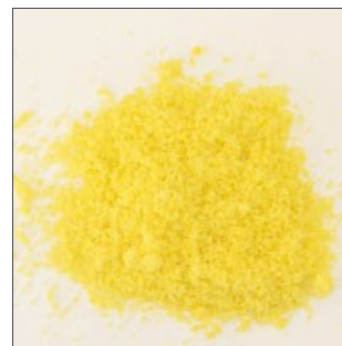
Однородный измельченный продукт