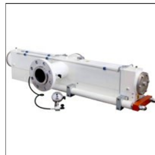
Головка для длинных макаронных изделий