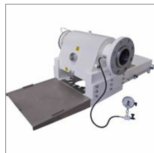
Головка для коротких макаронных изделий

Головки и трубки могут быть оснащены новыми и современными установками термостатации герметичного типа и талью для подъема матриц..