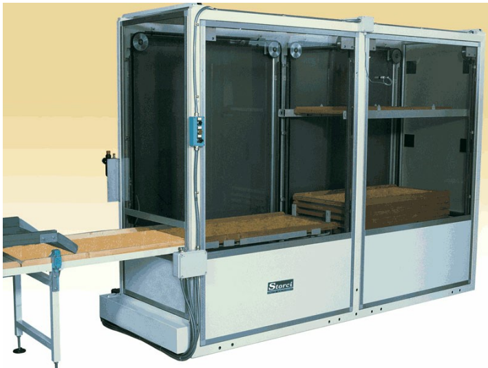
Укладчик рам Robo-t