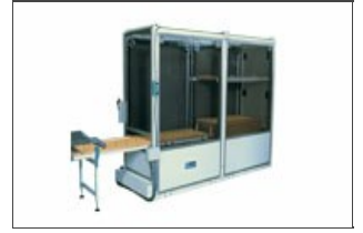
Укладчик рам Robo-t

Укладчик оснащен устройством оповещения о заполнении тележки и панельной обшивкой с функцией защиты. В качестве альтернативы имеется роботизированная система Robo XI.