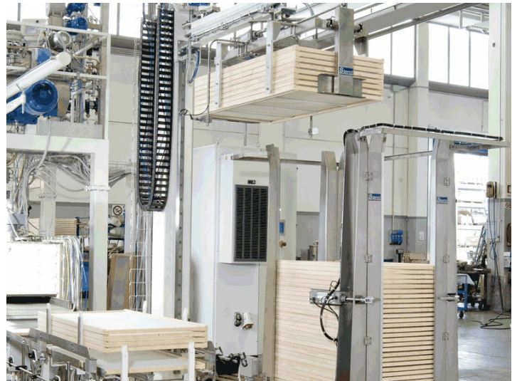
Robo XI: роботизированная система в конце линии